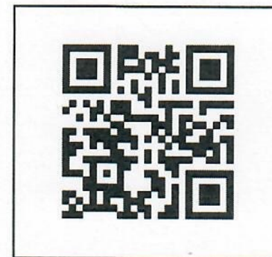
แบบฟอร์มขอรับทุนการศึกษา